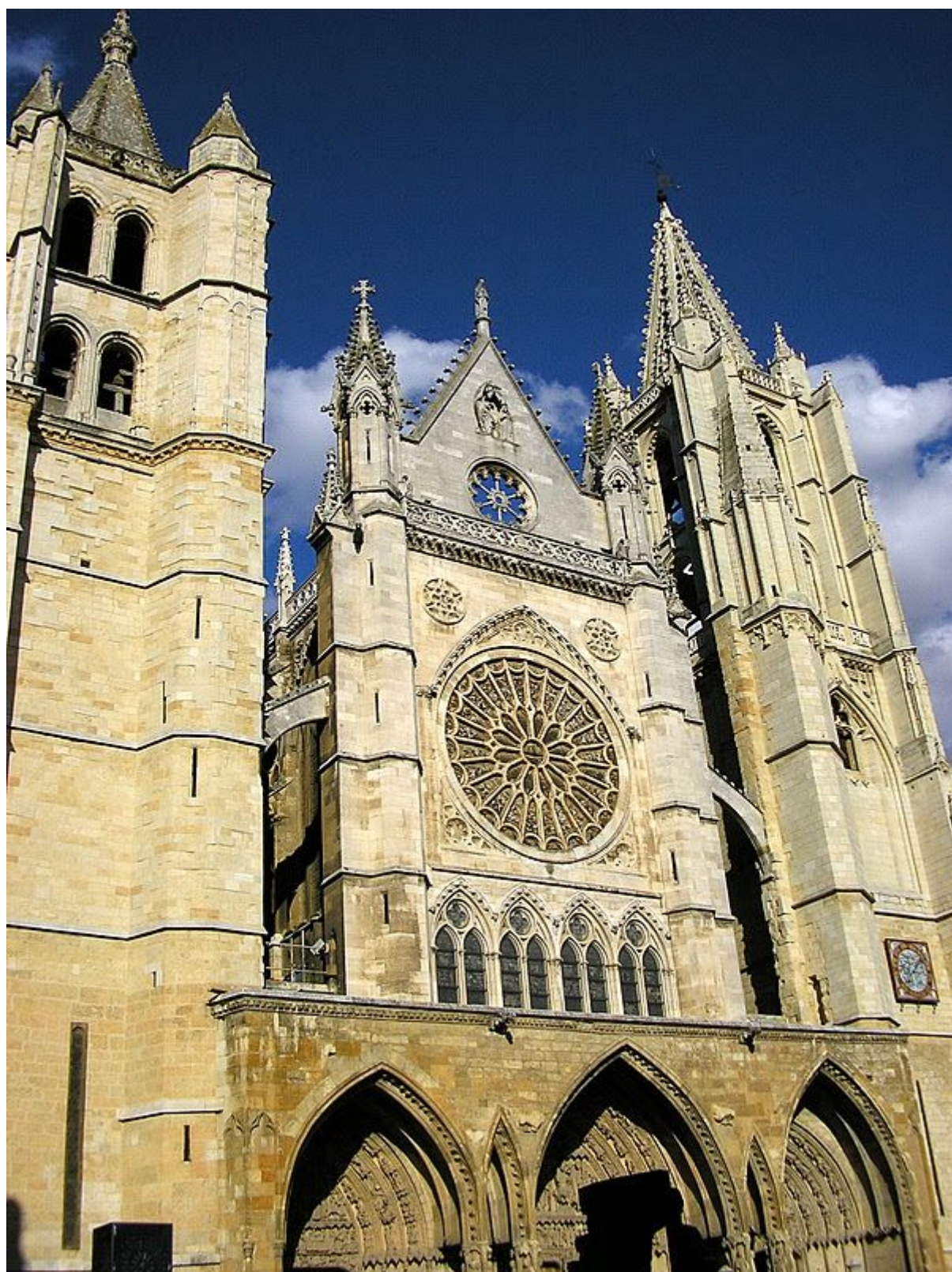
Catedral de León