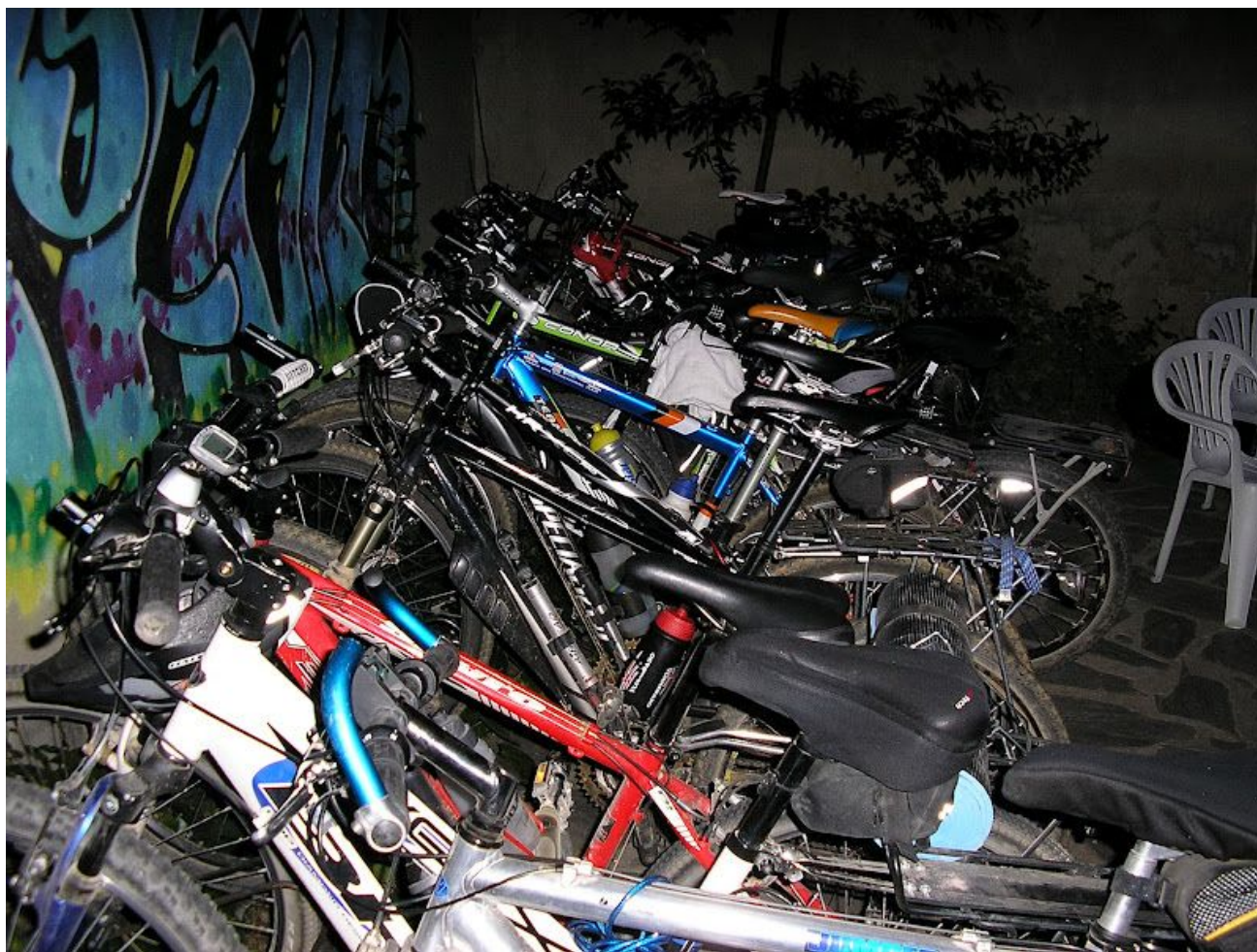
Aparcamiento para bicis en el Albergue San Javier

tengo excusa para volver a esta ciudad que tanto me ha sorprendido.