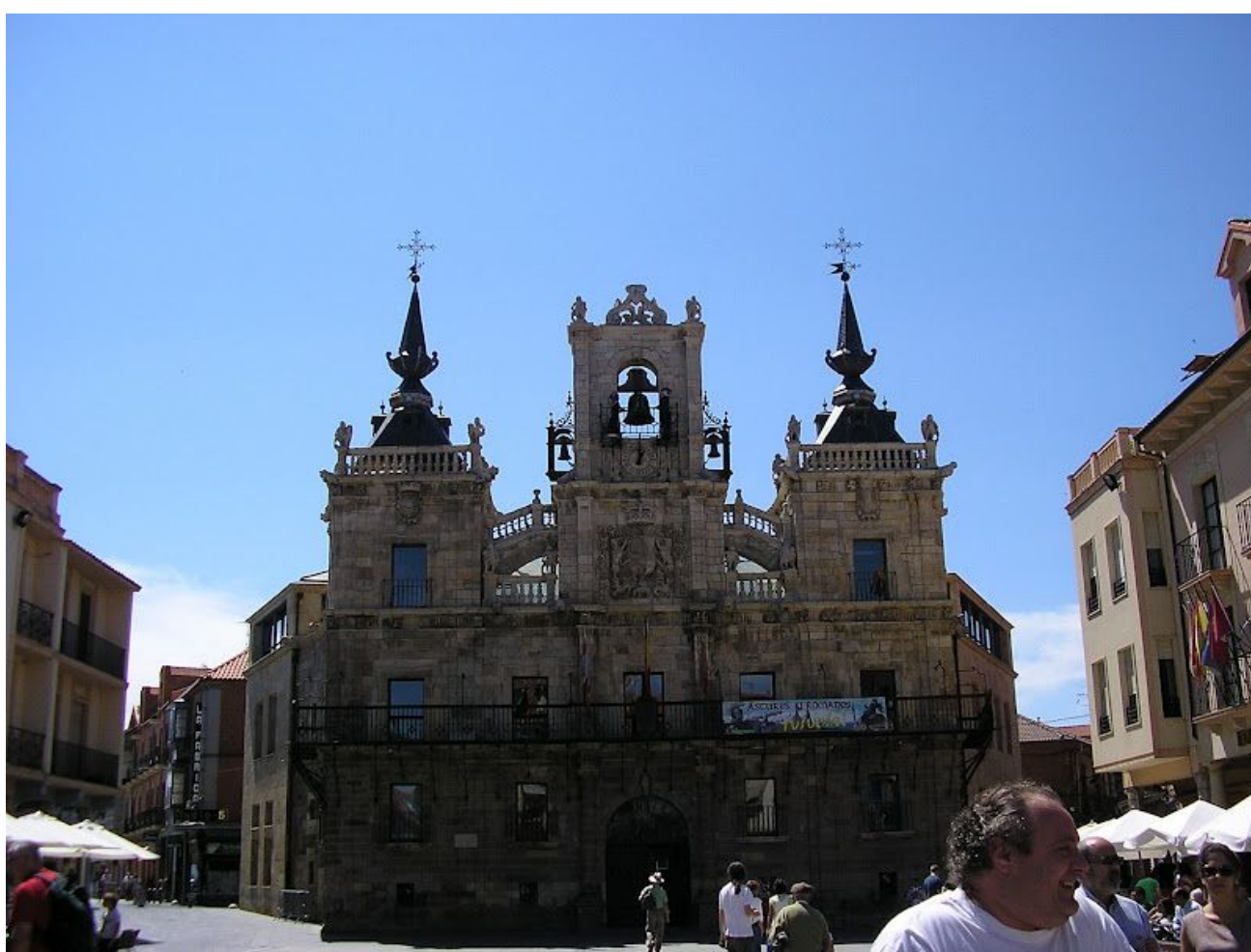
Ayuntamiento de Astorga

El Ayuntamiento de Astorga está presidido por el tradicional reloj de los maragatos Juan Zancuda y Colasa , obra del relojero Bartolomé Fernández en el siglo XVIII en el que dos autómatas son los encargados de dar las campanadas.