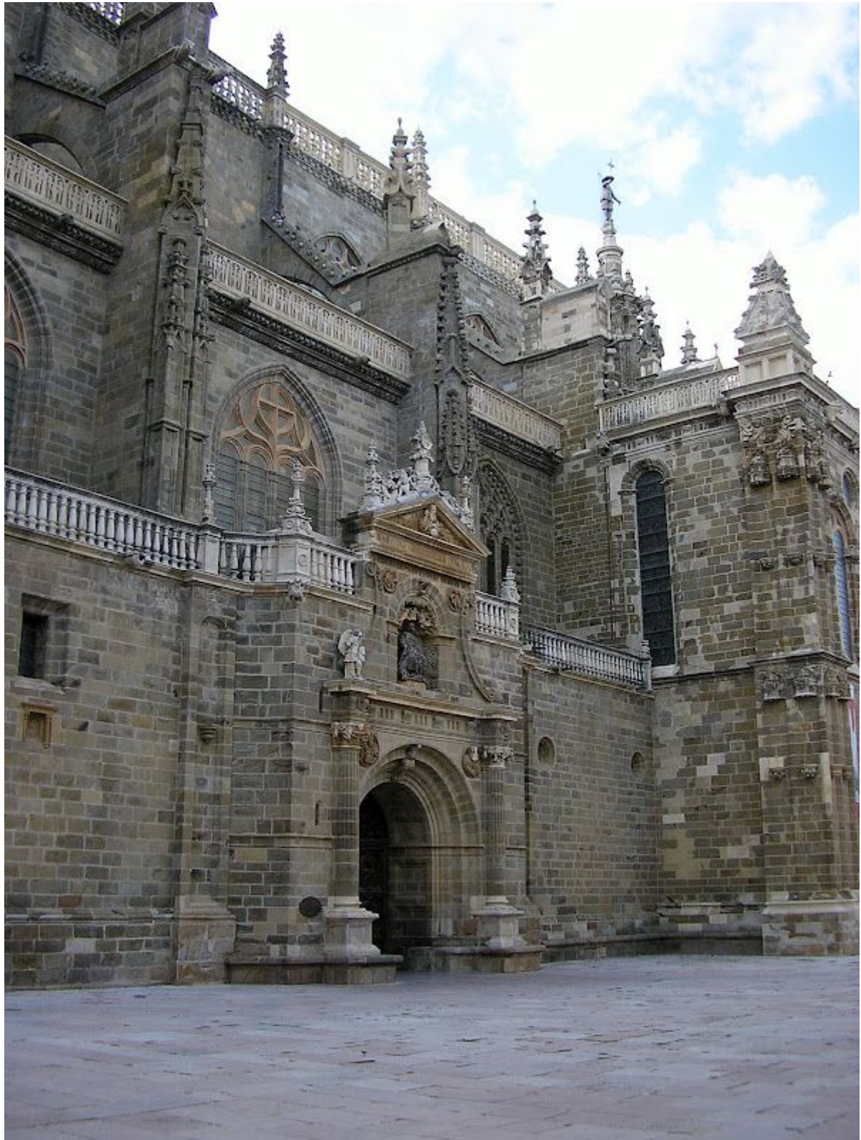
Fachada de la Catedral de Astorga

La Catedral es muy bonita tanto por fuera como por dentro, realmente merece la pena la visita.