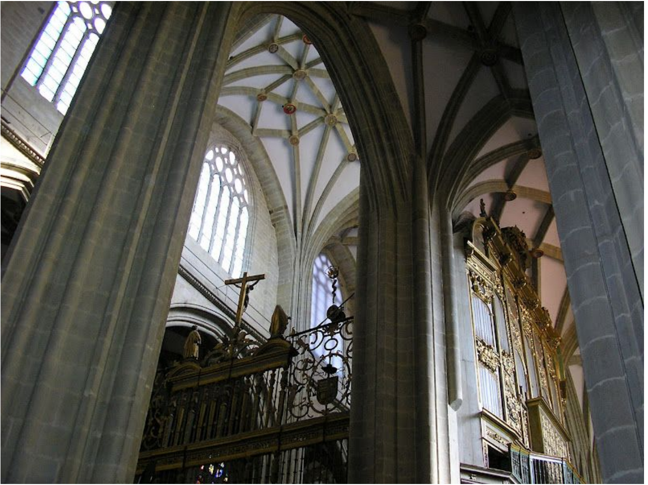
Interior de la Catedral de Astorga

Enseguida voy a visitar el Palacio Episcopal , más conocido como Palacio Gaudí , al lado de la Catedral, cuya existencia desconocía y que me ha encantado.