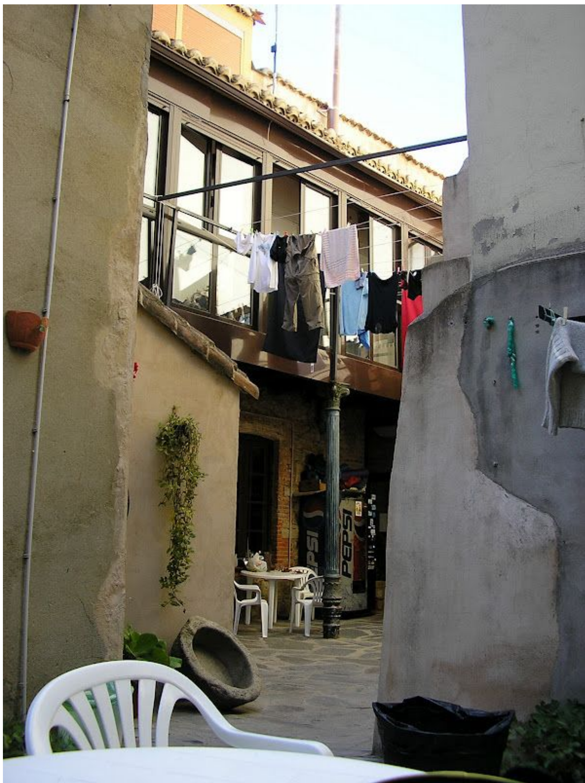
Patio del Albergue Privado San Javier (Astorga)