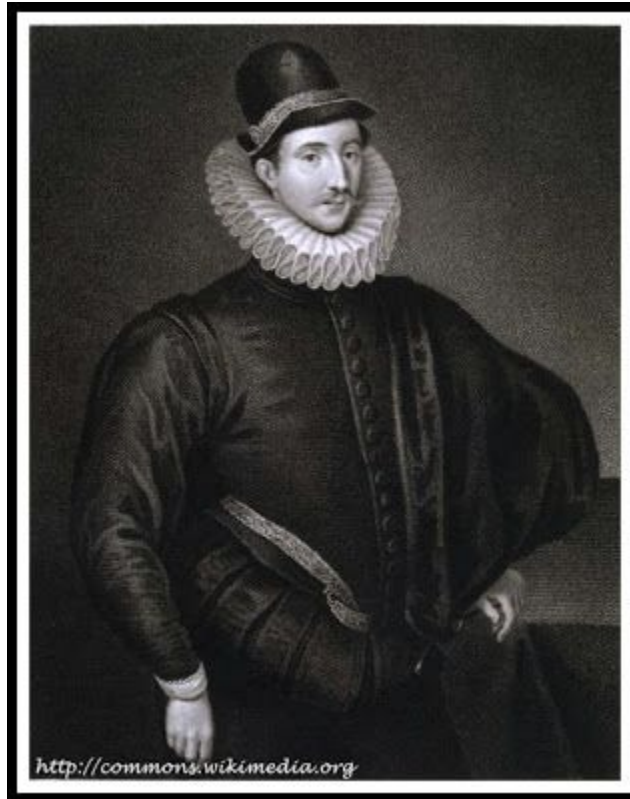
Sir Fulke Greville

Durante nuestra visita al Castillo de Warwick , un mayordomo con un encantador y rotundo acento escocés nos iba contando los entresijos de cada habitación del castillo y de la vida de los personajes que, a lo largo del tiempo, lo han habitado.