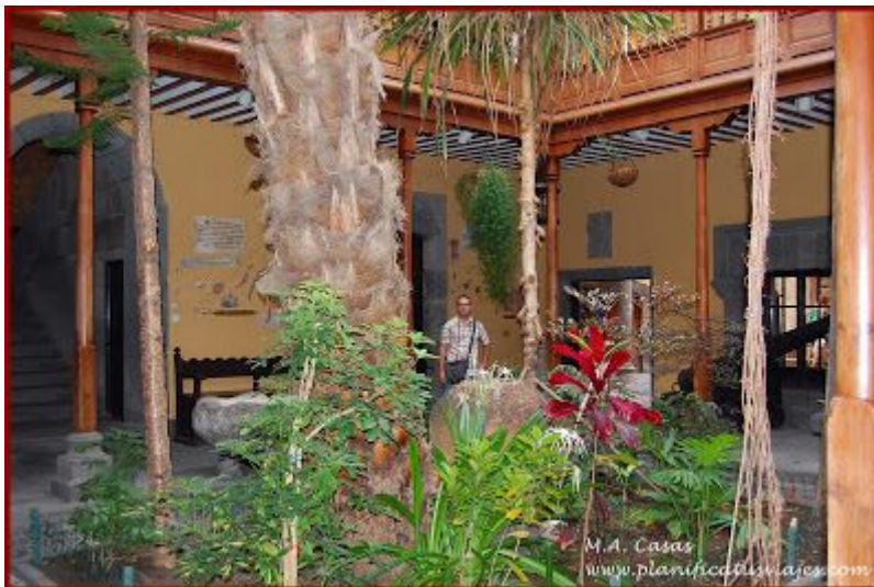
Interior de la Casa Museo de Colón