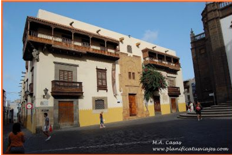
Casa Museo de Colón