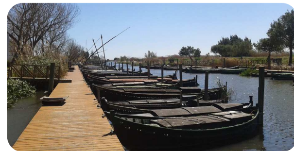
Port de Catarroja