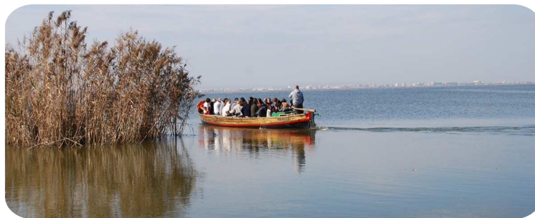
Navegació per l'Albufera