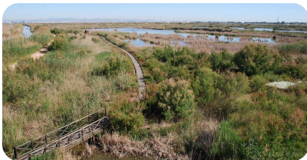
Tancat de La Pipa

Situat a la Carretera del Palmar s/n es troba el Centre d'Interpretació del parc natural. Disposa d'una exposició permanent, una torre mirador amb vista panoràmica de l'Albufera, i observatoris d'avifauna. Accés lliure, consultar horaris d'obertura i condicions de visita per a grups. Telèfon: 96 386 80 50 e-mail: raco_olla@gva.es