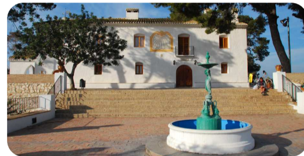
Muntanyeta dels Sants

Port de Silla: Pequeño puerto pesquero de l'Albufera. La Cofradía de Pescadores de Silla es junto a la de Catarroja y El Palmar, una de las que tienen el derecho a pescar en l'Albufera.